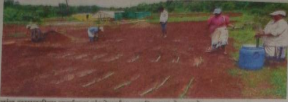
बांबू लागवडीचा कार्यक्रम संस्थेद्वारे राबविण्यात येत आहे.