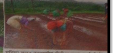
महिला बचत गटाद्वारे शेती व पुरूक अशी विविध केली जाताने. शैंगमगा लागवड करताना महिला.