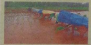
खारिपात सामुदायिक पद्धतीने चारधुनी भात लागवडीचा अखलवड केला.

शेतकऱ्यांना त्यांच्या घेतलेल्या तुळनेमध्ये अल्प मोबदला मिळतो. त्यामधील कारणांना शोध घेत शेती पौक तंत्र, अल्प उत्पादन खर्च, पर्यावरणपूरक खात्रीचे उत्पादन, बाजारपेठेतील मागणीनुसार उत्पादनाला संस्थेने प्रोत्साहन दिले आहे. बांबू, काळीगिरी, दालचिनी या फिकांसोबतच, सामूहिक भात-नाचणी शेती, सामूहिक बाजीपाळा लागवड, पाचसाली हंगामीपालन बाजीपाळा उत्पादन, जुन्या फळवारीचे पुनर्जीवन असे उपक्रम राबविण्यात आले. गेल्या ४ वर्षांत २०० एकरीभावा आर्थिक क्षेत्रावर ३०० पेक्षा अधिक शेतकऱ्यांच्या सहकार्याने प्रयोग करण्यात आले. या शेतकऱ्यांसाठी एका बचत गटातून स्वतःची शेतावटिका सुरु केली. त्यात सर्व प्रकारच्या शेतांबरोबरच माणगा बांबूची उत्तम दर्जाची शेते उपलब्ध आहेत.