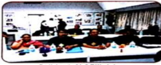
Participant of L & T Workshop

Larsen & Toubro Public Charitabel Trust & Sneh Samruddhi Mandal (Joint Venture)