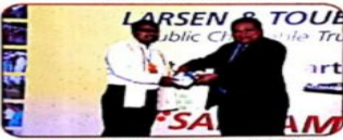
Receiving Momento from President of L & T, India