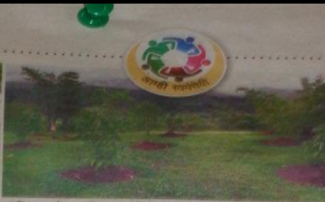
परिसरामध्ये शास्त्रीय पद्धतीने केलेली वृक्षलागवड.