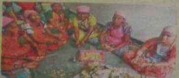
महिला बचत गटाद्वारे विविध पदार्थांची निर्मिती करून विक्री केली जाते.

महिलांमध्ये पाककला ही स्वाभाविकच असते. या वैशिष्ट्यांच्या जोरावर संस्थेने लॉसईन अँड टुब्रो पब्लिक चॅरिटेबल ट्रस्टच्या माध्यमातून विविध प्रकारची फळप्रक्रिया उभारताने सुरु केली. तसेच विविध प्रकारची घरगुती पिठे, केटरिंग सेवा, पॅकिंग, मार्केटिंग आदी विविध प्रशिक्षण सुरु केले. त्यातून गेल्या ४ वर्षांत १८५० महिला प्रशिक्षित झाल्या. यातील ७५० महिलांना विविध माध्यमातून रोजगार उपलब्ध झाला आहे. विशेष म्हणजे या प्रशिक्षित महिलांनी तयार केलेले पावड केवळ स्थानिक न शहरातील मार्केटमध्येच नाही, तर सुदोरीय देशातही विकले जात आहेत. प्रशिक्षणमुळे केटरिंग क्षेत्रातील कुशल कामगारांची गरज पूर्ण झाली आहे.