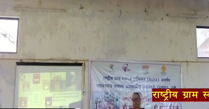
राष्ट्रीय ग्राम स्वराज्य अभियान