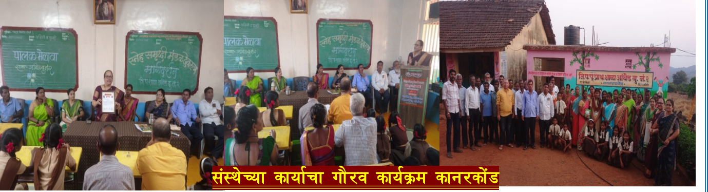
संस्थेच्या कार्याचा गौरव कार्यक्रम कानरकोंड

कानरकोंड आंबेड बुद्रुक तालुका संगमेश्वर येथील प्राथमिक शिक्षक बंधु यांच्या सहकार्याने शिक्षक आणि ग्रामस्थ यांच्यामार्फत सन्माननिय सरपंच आणि उपसरपंच यांच्या उपस्थितीमध्ये अतिशय उत्तम कार्यक्रमाचे संयाजन करण्यात आले होते. स्नेह समृद्धी मंडळ या सामाजिक संस्थेच्या कार्याचा गौरव व त्यांनी शालेय विद्यार्थ्यांना केलेल्या आर्थिक सहकार्याबद्दलचा आभार प्रदर्शन सोहळा संस्थेला सन्मानचिन्ह देऊन पार पडला.