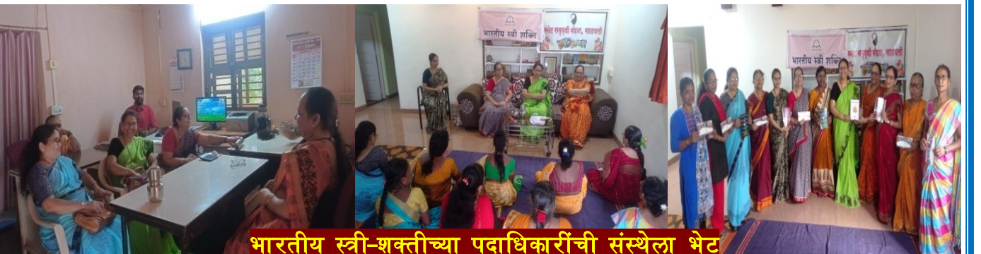
भारतीय स्त्री-शक्तीच्या पदाधिकारींची संस्थेला भेट

संस्थेचे पदाधिकारी आणि कार्यक्षेत्र पातळीवरील काम करणारे स्वयंसेवक व कार्यकर्ते यांची बैठक पार पडली. या बैठकीमध्ये संस्थेच्या कार्याचा अहवाल आणि भारतीय स्त्री-शक्तीच्या राज्यव्यापी सुरु असणाऱ्या कामाची ओळख अशा विषयांचा समावेश होता. त्यानंतर संस्थेच्या कार्यक्षेत्राला भेट यामध्ये नर्सरी-कासारकोळवण, महिलांची केटरिंग सेवा माध्यमातून रोजगार निर्माती करणाऱ्या गटाला प्रत्यक्ष कामाच्या ठिकाणी भेट व चर्चा.