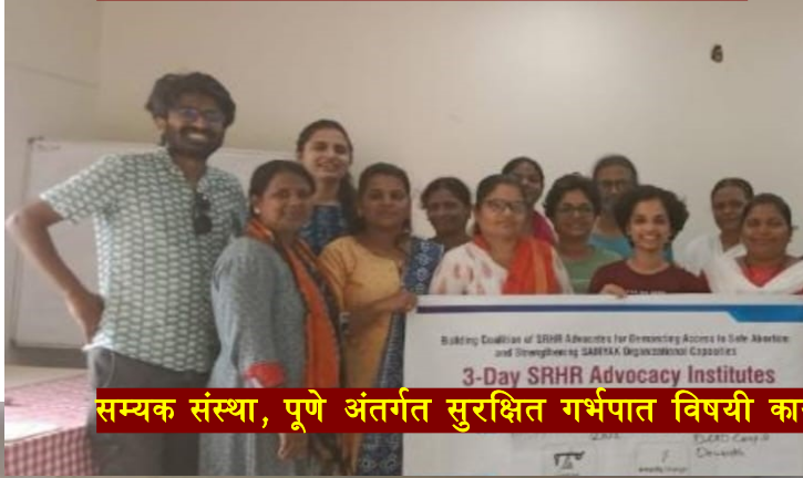
सम्यक संस्था, पुणे अंतर्गत सुरक्षित गर्भपात विषयी कार्यशाळा