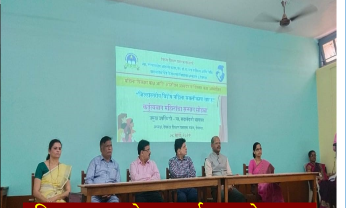
महिला सन्मान सोहळा कार्यक्रमांमध्ये सहभाग