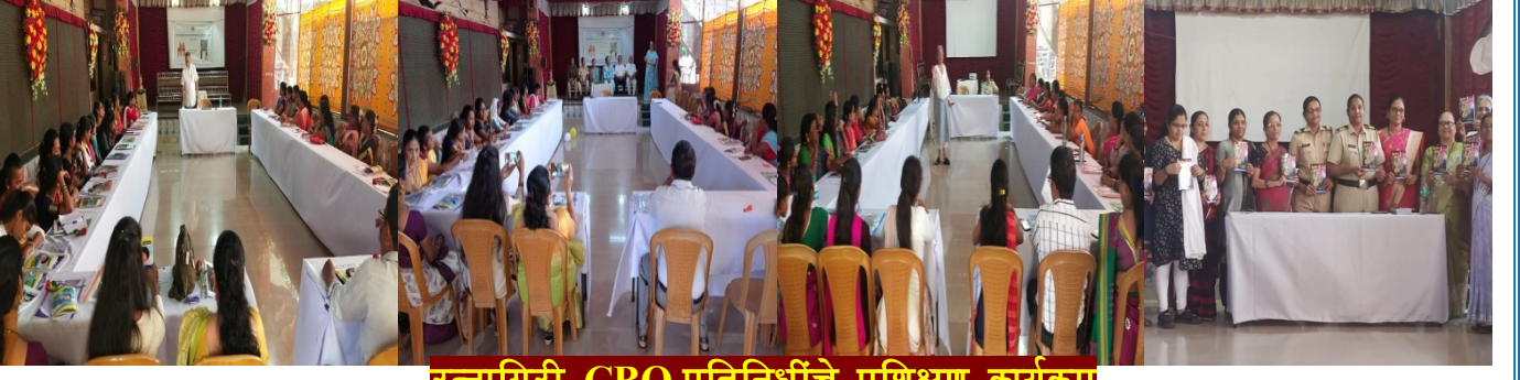
रत्नागिरी CBO प्रतिनिधींचे प्रशिक्षण कार्यक्रम