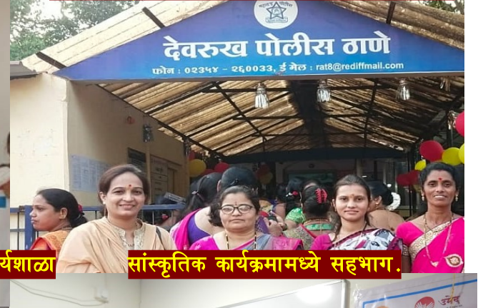
सांस्कृतिक कार्यक्रमांमध्ये सहभाग.