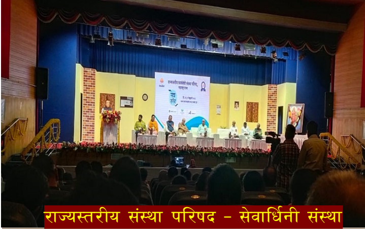
राज्यस्तरीय संस्था परिषद - सेवार्धिनी संस्था