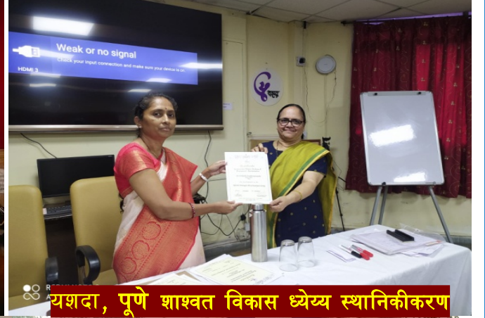
यशदा, पुणे शाश्वत विकास ध्येय स्थानिकीकरण