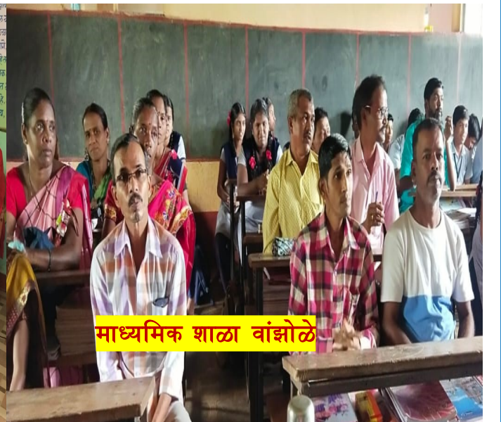
माध्यमिक शाळा वांझोळे