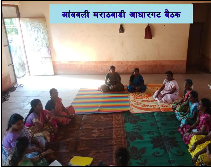
आंबवली मराठवाडी आधारगट बैठक